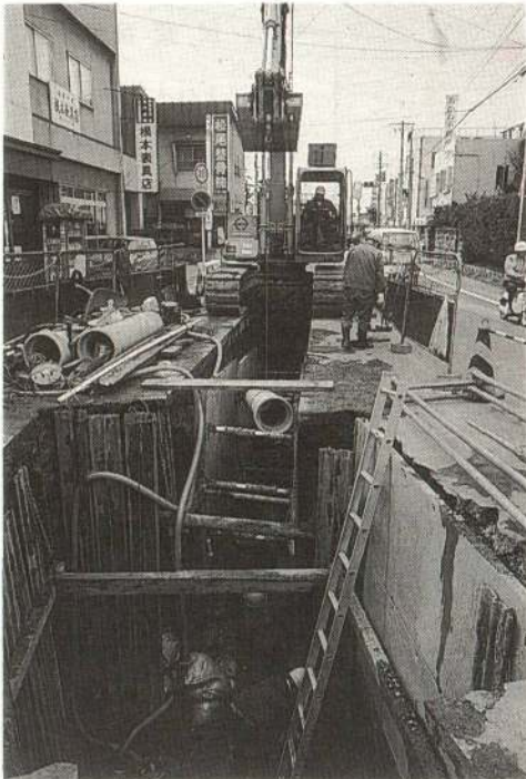
市の中心部で着々と進む下水道管敷設工事

計画(対象面積百三十㊦、対象人口五千七百三十人)は、平成五年度までに整備する予定です。が、その一部(対象面積九十一㊦、対象人口約四千人)が今年四月一日から供用開始になります。