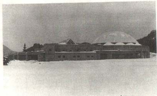
温水プール新設第二期工事

釈迦内公民館改築工事は、現在約七〇%の進捗よく率で、三月二十五日の完工に向け順調に