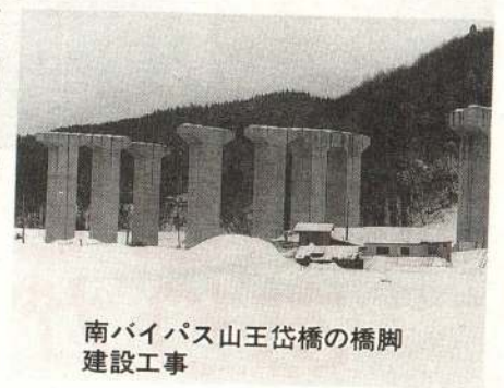
南バイパス山王岱橋の橋脚建設工事

用地の取得は、山館地内から池内ランプまでをほぼ終わっています。現在、山田渡地内の一部買収と、国道103号一舟場一