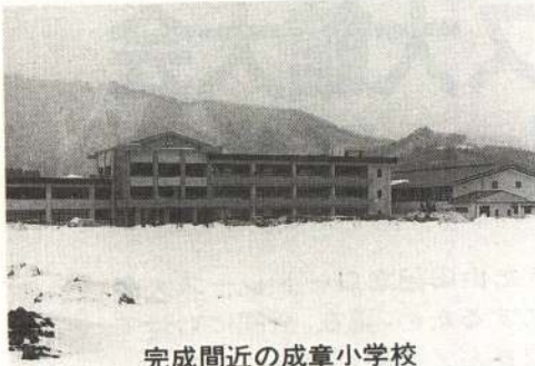
完成間近の成章小学校