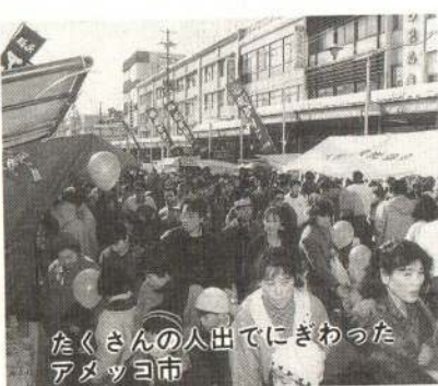
たくさんの人出てにぎわったアメッコ市