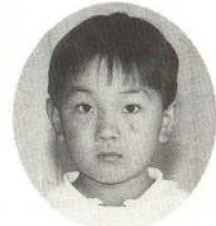
ほし たかのりくん りょうりはなんでも おいしいんだ。