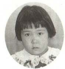
きくち みどりちゃん おいしいケーキをつ くってくれるの。