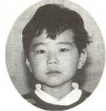
なりた ゆうきくん おこるときもあるけ どだいすき。