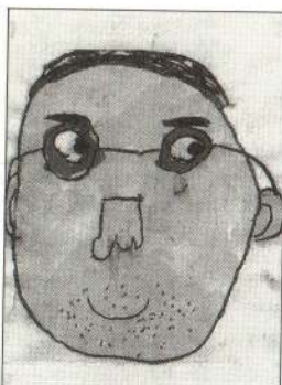
かなり きょうへいくん かくれんぼでオニのや くをやってくれるんだ。