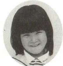
あらい ちひろちゃん トランプのばばぬさが すごくつよいんだよ。