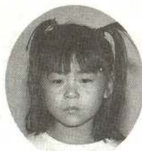
いしかわ みかちゃん おしごとでいつもおそ くかえてくるの。