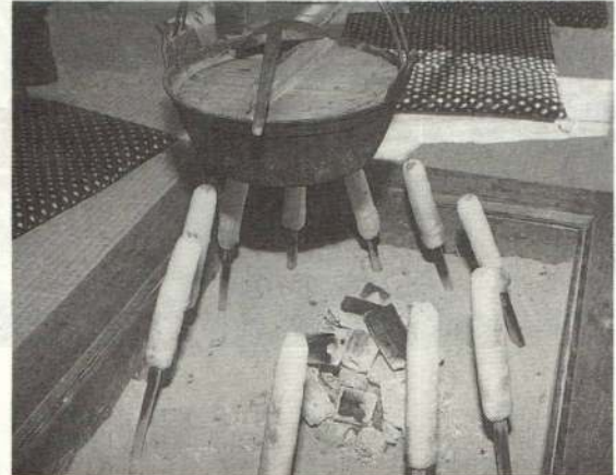
かためのごはんをつけたたんぽを 炭火でじっくり焼きます