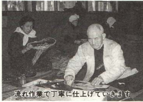
流れ作業で丁寧に仕上げられています

会ができたのは、昭和五十二年でしたかね。高村白寿会という老人クラブの有志四、五人が、自分たちでできることをと集まって彼岸花を作り始めたのがきっかけです。会員は多い時で十