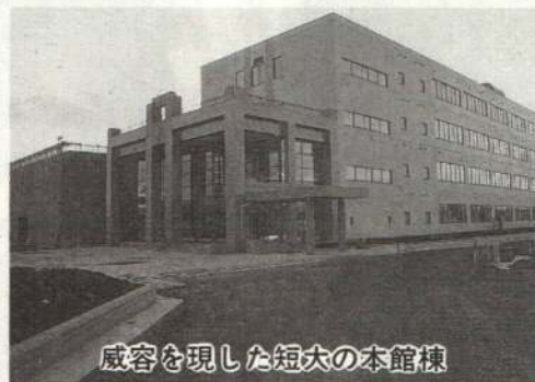
威容を現した短大の本館棟