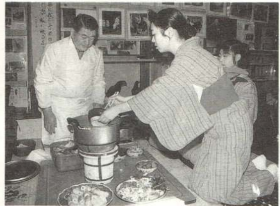
たんぽを入れて2〜3分後にネギ を入れます