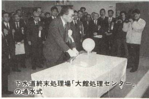
下水道終末処理場「大館処理センター」 の通水式

秋田経済法科大学で大館短期 大学設置準備事務室を設置 。モデル三町内で、指定袋を使 用したごみ分別収集試行開始 。住環境整備方針策定調査報告 書まとまる 。鋒形石器など四件を市文化財 に指定