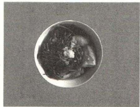
セリを入れて出来上がり

出来上がったきりたんぽに、大輪菊の花びらを散らすと香りが引き立ちます。また、大根の搾り汁をかけると、さっぱりとした味付けになります。家庭で普段つくっているきりたんぽとは、一味違った「山田流」を一度、試してみたいかが？