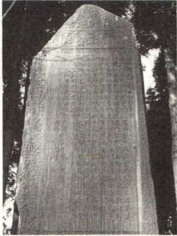
▶源守院境内にある顕彰碑