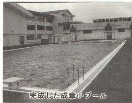
完成した成章小プール

市では、高齢化社会に対応するため、今月一日、福祉事務所内に老人福祉施設誘致担当を配置するとともに、市老人福祉総合エリア検討委員会を設置しました。これは、県が進めている老人福祉総合エリア計画を市に誘致するための活動をさらに強めていくものです。