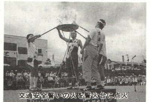
交通安全誓いの火を誓火台に点火

成章小学校プール完成 。在京経済人小委員会懇談会を 初めて大館で開催 。十二所保育園完成 。湯夢湯夢の里温水プール完成 ——オープンは一月五日