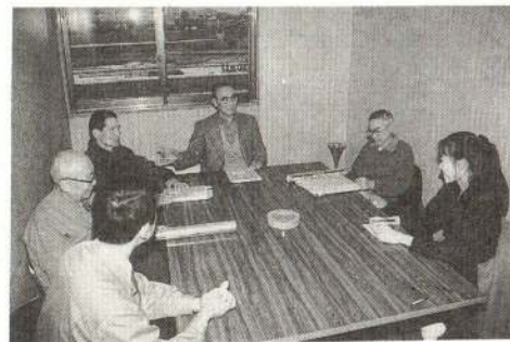
会の皆さんに熱心に質問

ブルドーザーなどの機械は使えません。このため、手作業で氷を割っていきます。氷が張るぐらいの寒い日ですから、白鳥を