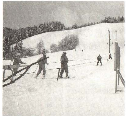
Tバーリフトが完成した大滝温泉スキー場

市内には、スキー場が四カ所あります。大型スキー場には劣りますが、気軽に行けるのが魅力です。また、大滝温泉スキー場には、新たにTバーリフトが完成しました。身近な市内のスキー場に出掛けてみませんか。 〔大滝温泉スキー場〕 Tバーリフト1基 ナイター照明あり 営業時間・午前9時～午後5時 (ナイター・午後5時～同9時) ※ナイターは木・金・土 道目木字陣場岱地内 〔達子森スキー場〕 ロープトウ2基 営業時間・午前9時～午後5時 二井田字田子森1 〔大館スキー場〕 ロープトウ1基 電話 55-0571