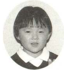
いしだ たくくん うちのブランコはやくだしてほしいな~