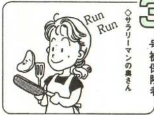
3号被保険者 ◇サラリーマンの妻さん

保険者の期間がある人には、その加入期間に見合った上乘せ給付の厚生年金または共済年金が支給されます。結婚や就職・退職などで種別が変わったときは、市民課年金係で忘れずに「種別変更」の手続きをしてください。