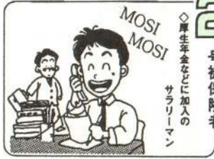
2号被保険者 ◇厚生年金などに加入のサラリーマン