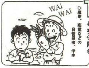
1号被保険者 ◇農業、商業などの自営業者、学生

国民年金の加入者の種別は、第一号から三号までの三種類。必ずいずれかに入っています。国民年金からは全国民に共通の基礎年金が支給され、第二号被