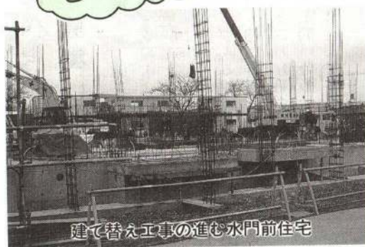
建て替え工事の進む水門前住宅