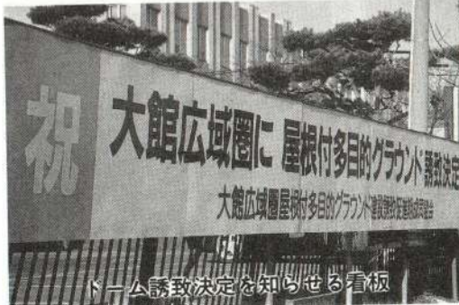
ドーム誘致決定を知らせる看板

・屋根付多目的グラウンド建設誘致が県によって決定されたことを受けて、ドーム建設を含めた周辺地域の基本計画を策定します。