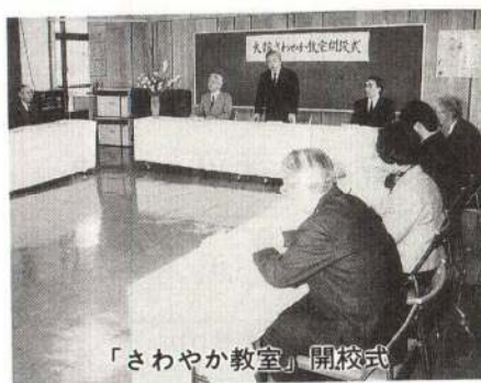
「さわやか教室」開校式