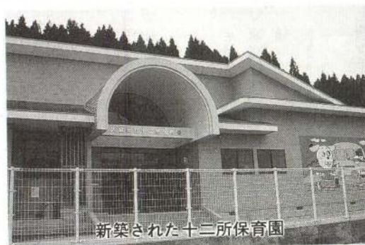
新築された十二所保育園

市では、大きな事業を行う際に必要な財源を、国(郵政省など)や銀行などから借りています。四年度には、厚生年金・国民年金積立金還元融資三億千百万円、郵政省の簡易生命保険積立金還元融資四億千七百万円を受けて、次の事業を進めました。