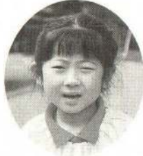
はが しほりちゃん カメラでしゃしんを とってくれるのよ