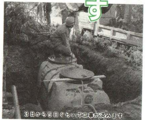
3日から5日ぐらいで工事が済みます

ちなみに、ヤマメやイワナが住む川はBODが一総中二ミグラム以下。BOD五ミグラム以上の川に、魚は住みません。川を汚している主な原因は生活雑排水です。公共下水道、農業集落排水事業によるミニ下水