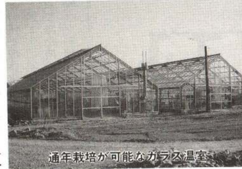
通年栽培が可能なガラス温室

・真中地区へ地域種苗センターを建設します。この事業はガラス温室・パイプハウス・床土施設を設置し、シ