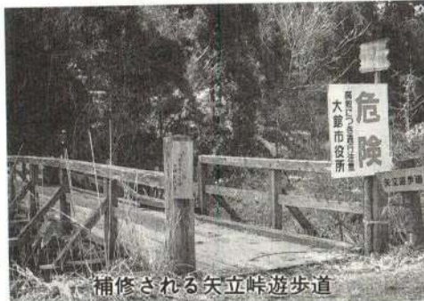
補修される矢立峠遊歩道

植栽工事など、修景施設の整備を進めます。 ・台風被害で立ち入り禁止となっていた矢立峠遊歩道の