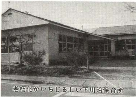
老朽化がいちじるしい下川沿保育所

老朽化が進んでいた下川沿保育所を、単人団地入口へ移転改築します。（木造平屋建約七百平方メートル） 乳児保育園を泉町へ移転改築し、狭あい問題を解決します。