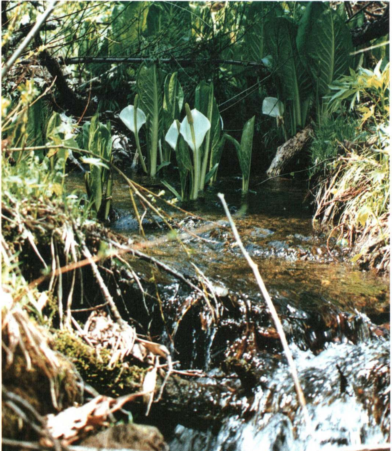
● 長木川源流部 ●