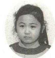
ふじがき あさみちゃん やすみにこうえんへ つれてってくれるの