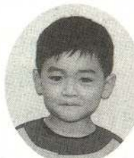
こばやし りょうたくん いっしょにゆうえん ちへいったんだよ