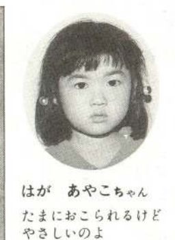
はが あやこちゃん たまにおこられるけどやさしいのよ