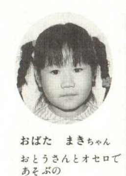
おばた まきちゃん おとうさんとオセロであそぶの