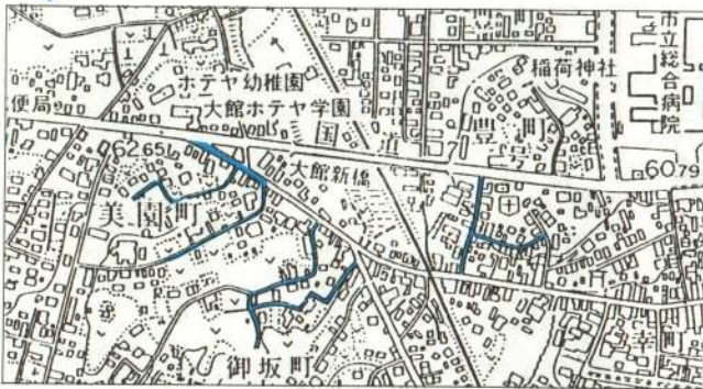
幸町・美園町地区工事箇所