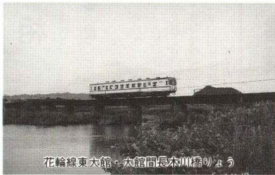
花輪線東大館。大館間長六川橋のよう

久保田藩の大館地方と密接な関係があった。ことに、鹿角地方には南部藩のドル箱ともいえる尾去沢、小坂などたくさんある山があつて、これらから産出された銅は、冬期間を除き日本海岸の能代港から長崎へ回送されていた。こうしたことで、大館と鹿角地方、鹿角地方と盛岡というの昔から切っても切れない結び付きがあつたのである。