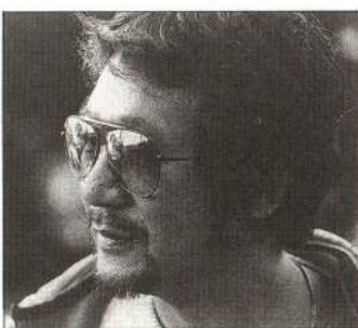
大林 宣彦 氏

昭和13年生まれ、広島県尾道市出身。映画製作・監督。「転校生」「時をかける少女」「さびしんぼう」など多くの作品がある。奥さんは大館市出身。