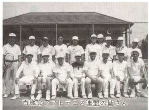
百歳会ソフトテニス連盟の皆さん

年中ソフトテニスを楽しんでい ます。百歳会の全県大会や東北 大会もあり、大館支部はそれら の大会で好成績をあげています。