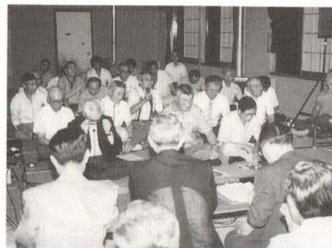
貴重な提言がたくさん出された移動市長室（平成4年）