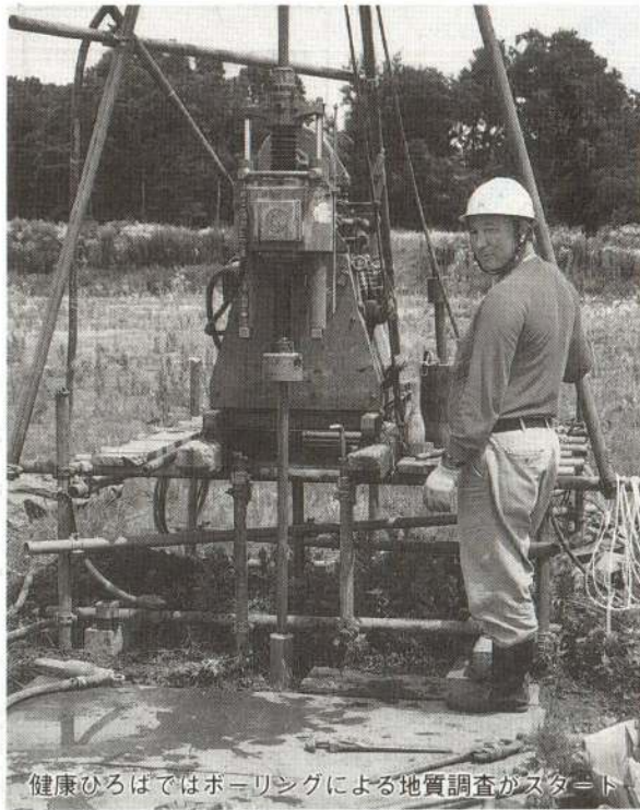
健康ひろばではボーリングによる地質調査がスタート

ラウンド建設誘致促進期成同盟会」を設置し、陳情、誘致運動を展開してきました。五年三月の県定例会議で大館市へのドーム施設建設が正式に決定。また、五年度からは小