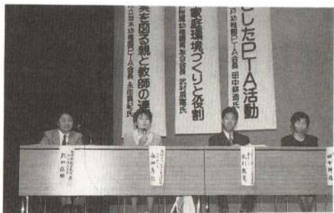
実践を通じた事例を紹介した発表者

「望ましい環境づくりによる幼稚園教育の想像とPTA活動の推進―人間形成の基礎となる育ちをめざして」を大会テーマに、二日間にわたって望ましい幼稚園教育はどうあるべきか熱心に研究討議されました。大会初日の役員会、理事会等