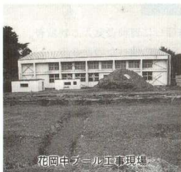
花岡中プール工事現場