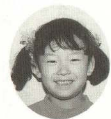
さとう あいちゃん やさしいのよ。わたしに ひこうきしてくれるの