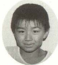
あぶかわ ゆうじくん いっしょにファミコンするけど、じょうずだよ