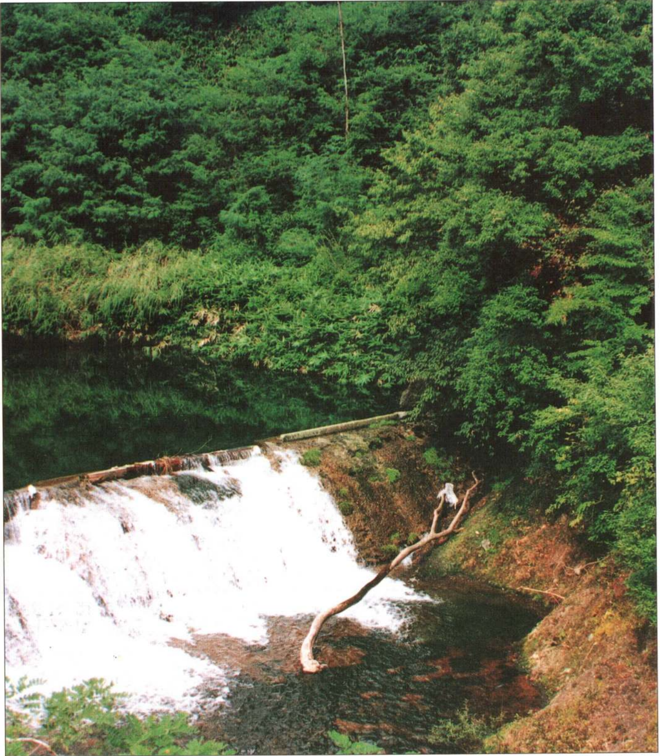
● 長木川茂内屋敷付近 ●