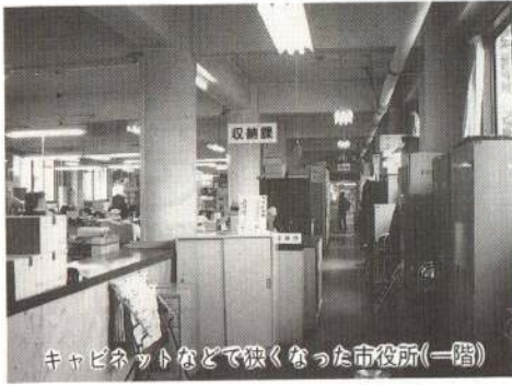
キャビネットなどで狭くなった市役所(一階)

現庁舎は老朽化が進み、事務の多様化や事務量の増大にともなう狭くなってしまいました。駐車場のスペースも同様で、いともたいへん混雑しています。