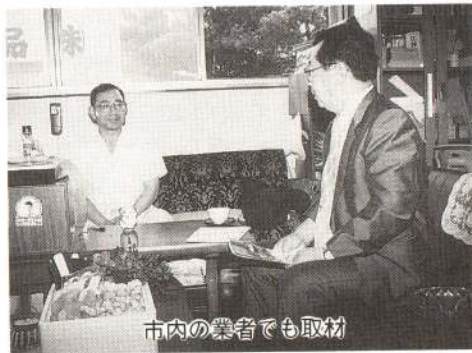
市内の業者でも取材

今回、三方所を取材しましたが、小包を贈る側のひとりとして、ふと、小包の中にあいさつ程度の手書きメッセージを入れるられるようにしたらと考えました。現行の郵便法では通信文の同封は認められていないということだったので、メッセージ入りのふるさと小包なら、いっそう贈り主の心が込められるのではないのでしょうか。大館郵便局の今年の目標は六千個と伺いました。きりたんぽはもとより、大館のPRのためにも、ぜひ目標を達成するようがんばって欲しいと思います。