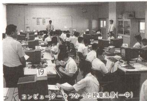
コンピューターをつかった授業風景(一中)

今年度、導入を予定しているのは、南、花岡、矢立、雪沢の各中学校で、この四校に配置が