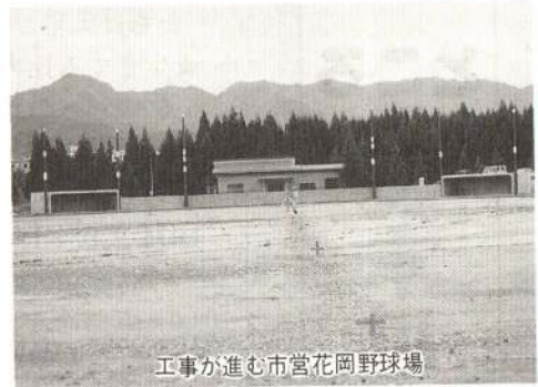
工事が進む市営花岡野球場

「市営花岡野球場」は、両翼九十七メートル、センター百二十メートルの本格的な野球場となり十月下旬に竣工する予定です。これが、完成すると四つ目の市営野球場となります。