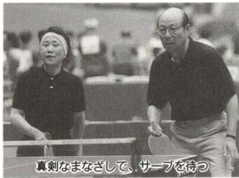
真剣なまなざしで、サーブを待つ

全国大会も開かれているんで すが、県北地区ではまだあまり 知られていないみたいです。