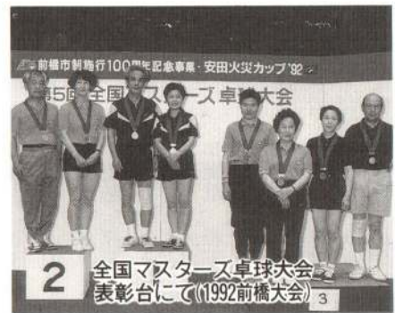
全国マスターズ卓球大会 表彰台にて(1992前橋大会)

昨年(前橋市)で開かれた「全 国マスターズ卓球大会」の五十 代ミックスダブルスの部で三位 になりました。また、今年京都 で行われた全国大会では、六十 歳クラスのシングルの部で三位 に入ることができました。大会 には八十歳を過ぎた人も参加し てるんですよ。 毎週日曜日に、有浦スポーツ 館で午後一時から三時まで、オ レンジエローのボールを追い かけながら汗をかいています。 また、愛好会では、全国マ スターズ卓球大会に出場できる 四十歳以上の会員を募集してい ますから、仲間に入りたい人は 是非有浦スポーツ館へ来てほし いですね。