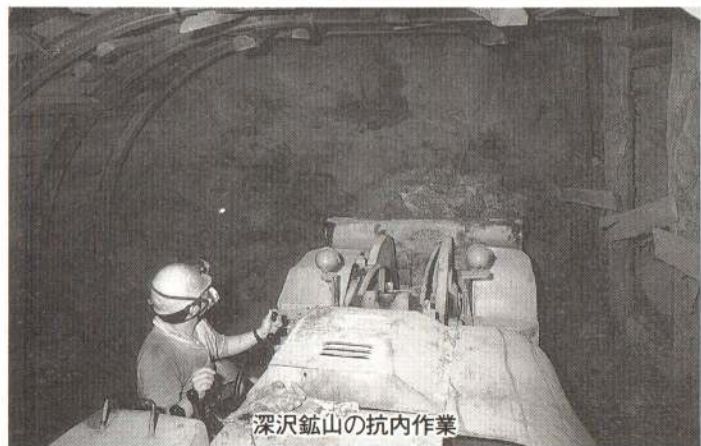
深沢鉱山の坑内作業

する最重要課題であるとして、十二月二日に産業部商工課内に「大館市鉱山緊急対策協議会」を設置して対応にあたることにしました。協議会は、県北秋田地方部、大館公共職業安定所、大館商工会議所、花矢商工会、花矢地域振興連絡協議会、秋田資源開発建設事業協同組合、大館市議会、大館市の八団体で構成され、会長には大館市長が就任しています。