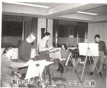
製作中の「アートパーゴラ」会員

「アートパーゴラ」は、昭和五十年に中央公民館の油絵教室に集まった仲間たち二十人ぐらいで始めた「四季彩会」が前身なんです。転勤などの理由で会員が減少し一時中断していたん