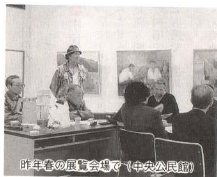
昨年春の展覧会場で(中央公民館)

カンバスに向かっていている時はいつも無心になっていて、身の周りの慌ただしさを忘れてしまっています。「絵の楽しみって何」って人によく聞かれるんですけど、カンバスに自然の美しさを再現することによって自分の心が洗われるような気がするんですね。絵を描くようになってから、今までになく見過ごしてきた周りの風景などの美しさにハッと気付いたり、感動したりすることがたびたびあります。