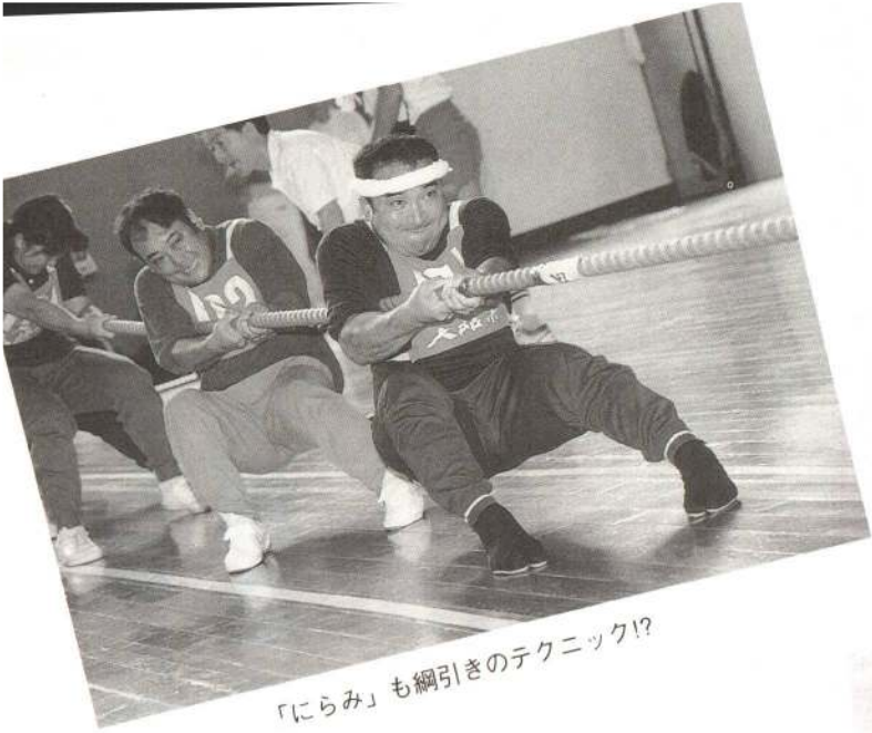
「にらみ」も綱引きのテクニック!?

9月4日、第3回大館市スポーツレクリエーション祭が、長根山運動公園をメイン会場に開催されました。より多くの市民が気軽にスポーツに親しめるよう、スポーツの中にレクリエーションの要素が取り入れられたこの大会には、市内13地区の代表選手や自由参加者など、合わせて約2,000人が参加。多彩な競技種目に熱戦を展開して汗を流しました。さわやかな笑顔で満たされた各会場では、スポーツを通じた心のふれあいも盛んだったようです。