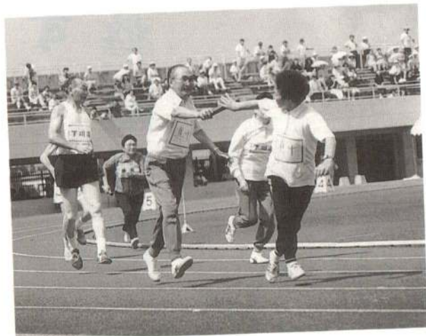
「あとは頼んだぞっ!」

9月4日、第3回大館市スポーツレクリエーション祭が、長根山運動公園をメイン会場に開催されました。より多くの市民が気軽にスポーツに親しめるよう、スポーツの中にレクリエーションの要素が取り入れられたこの大会には、市内13地区の代表選手や自由参加者など、合わせて約2,000人が参加。多彩な競技種目に熱戦を展開して汗を流しました。さわやかな笑顔で満たされた各会場では、スポーツを通じた心のふれあいも盛んだったようです。