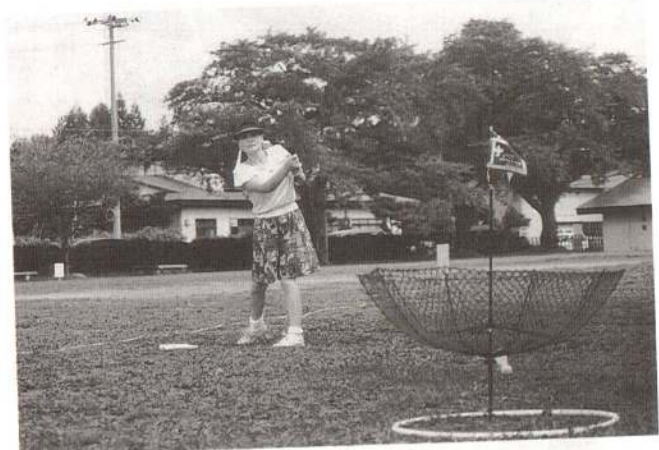
ナイスショット! ターゲットパードゴルフは気軽に楽しめます