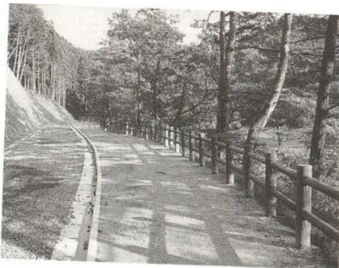
▶ 道が広く、明るくなりました

間もなく岩神貯水池を一周できる遊歩道が整い、今まで以上に快適に自然に触れることができるようになります。ご期待ください。