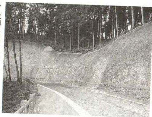
▶ 法面には芝を張り付けます