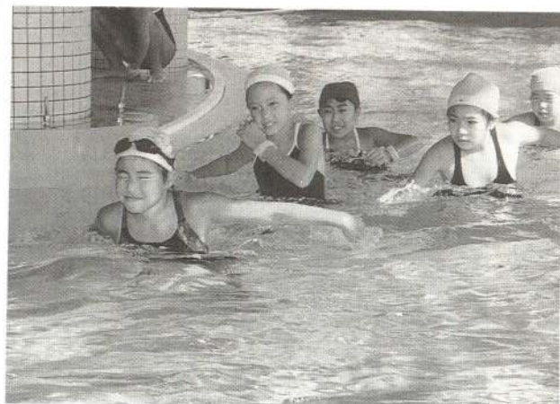
▲「流れにさらかって前へ：歩けないよ！」 —流水プール立ち歩き競争—