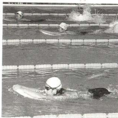
▲規定の時間に一番近い人が勝ち。 「えっ、速いだけじゃだめなの？」 —ビート板競争—