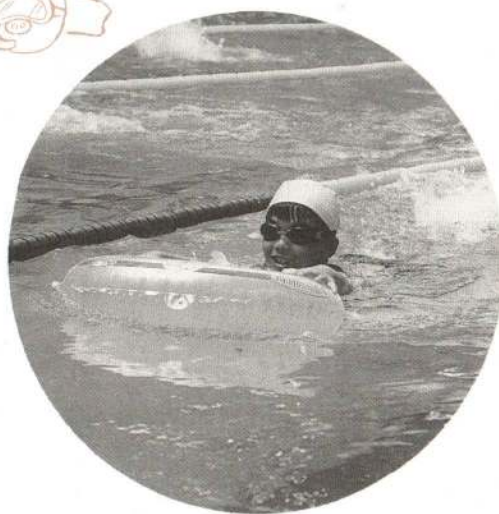
▲手を使わずに泳ぐのはなかなか大変 —浮き輪運び競争—