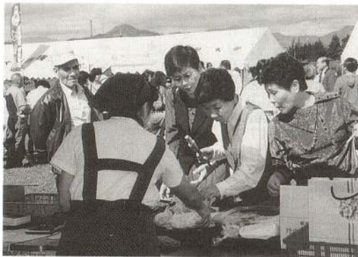
◀ 会場では、きりたんぼ鍋の材料などを大特売(本場市)