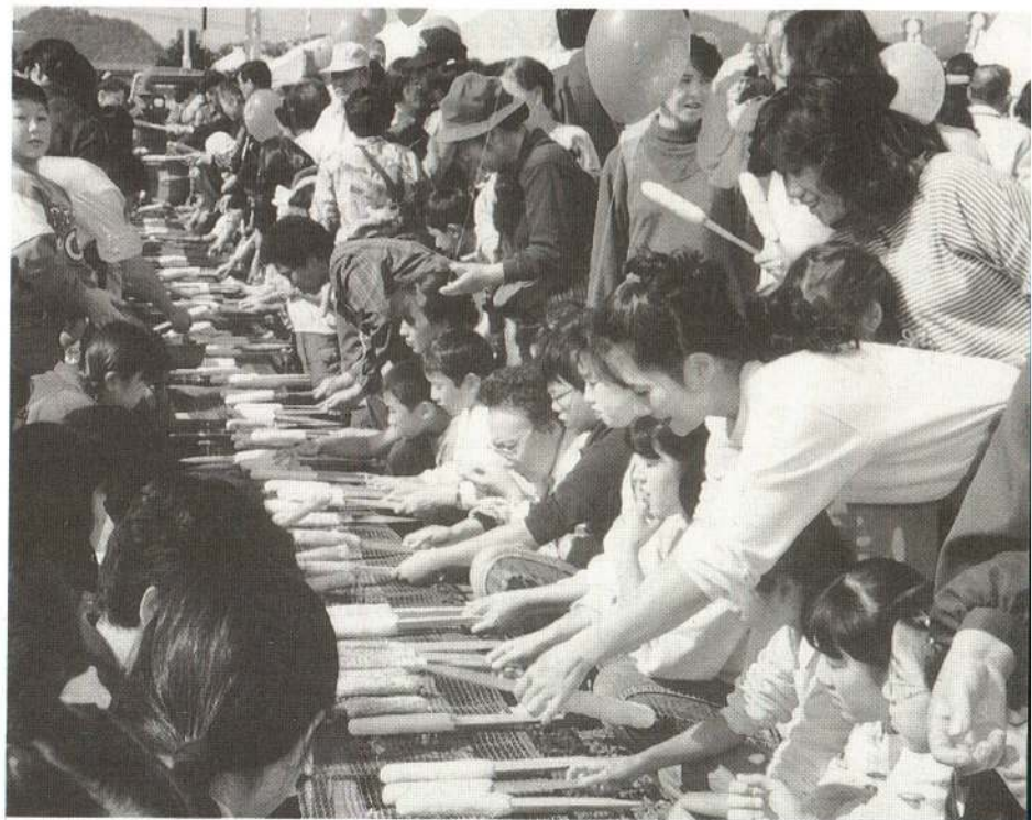
▲ 焦げつかないようにゆっくり回しながら焼きます。「もういいかな？」 (たんぼ1000本焼き)