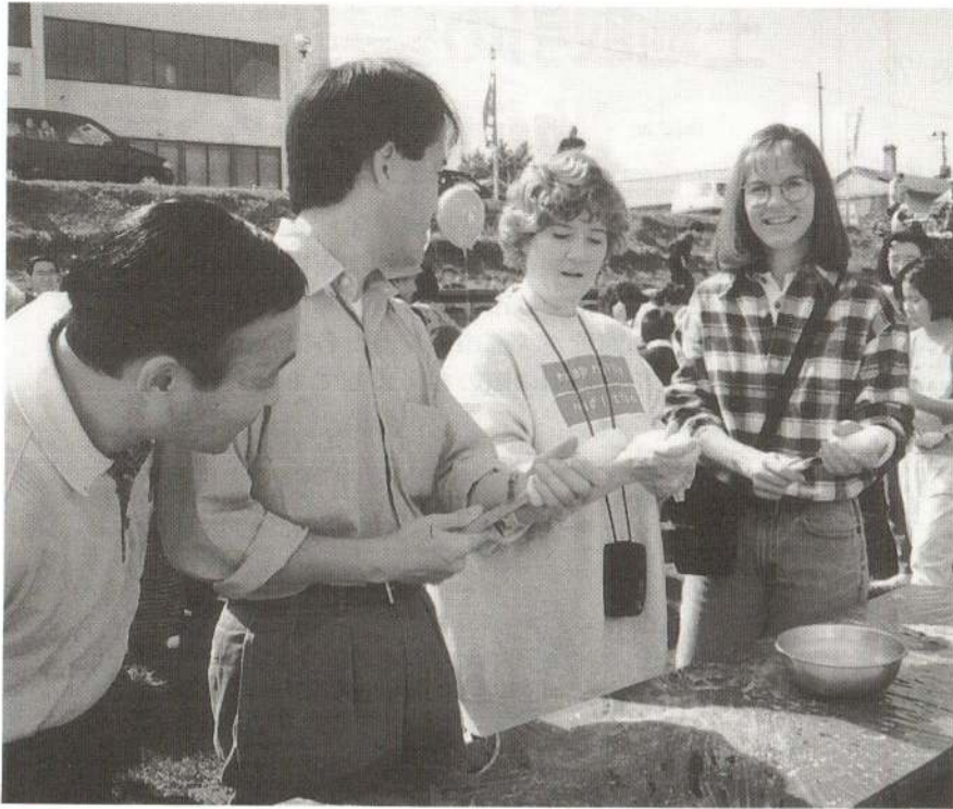
▲ 手を水でぬらして、秋田杉の串にご飯をつけ、手で伸ばしながら巻き付けます (たんぼ1000本焼き)

十月八日、九日、さわやかな秋風の中で本場大館「きりたんぼまつり」が開催され、長木川市民ひろばには「きりたんぼ村」が開村されました。会場では、たんぼ千本焼、きりたんぼ鍋大会などいろいろなイベントが行われ、訪れた人たちは本場の味に舌鼓を打っていました。