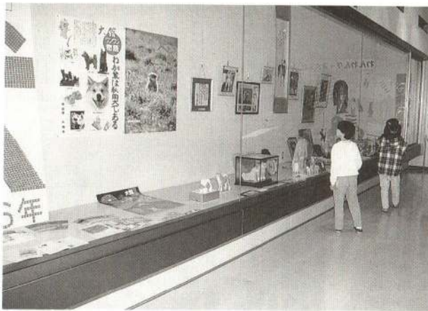
▲ ハチ公に関連した思い出の品々がズラリ勢ぞろい