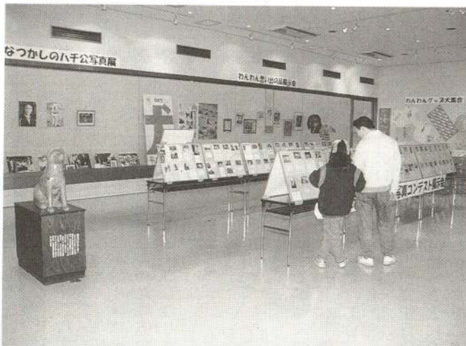
▲ 「おとうさん、この人、犬とそっくりだね」全国各地から231点の応募があった「愛犬と私のそっくり写真コンテスト」