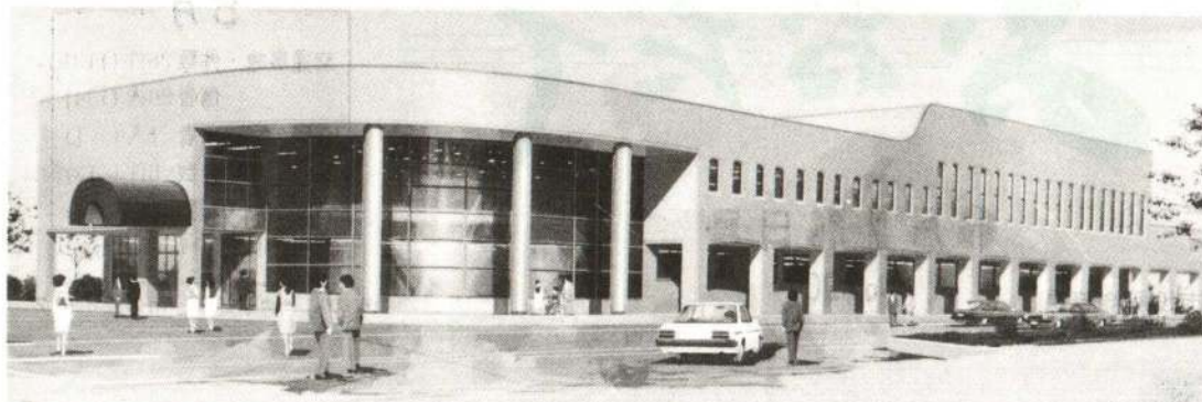
中央公民館完成予想図