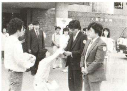
5月19日、海外たすけあい全国キャラバンが、青森県の青年赤十字奉仕団(右)から大館の同団へと引継がれました。(市役所前)

ら南に折れ、三哲山を覆う樹草の中に歩を進め、太い松根が乱れからみあう急な参道を登りつめると、深閑とした三哲神社にたどりつく。社殿わきの手水鉢は三哲が作ったものという。冷たい泉の水で喉を潤おし、十二所を一望に見下す時、ひとり黙々と修業をつむ、三哲の姿がしのばれる。