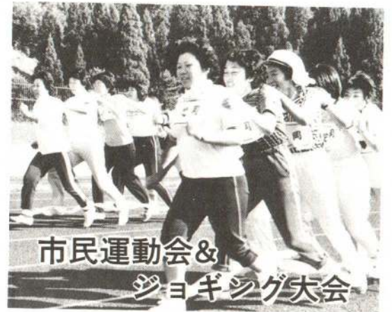
市民運動会 & ジョギング大会