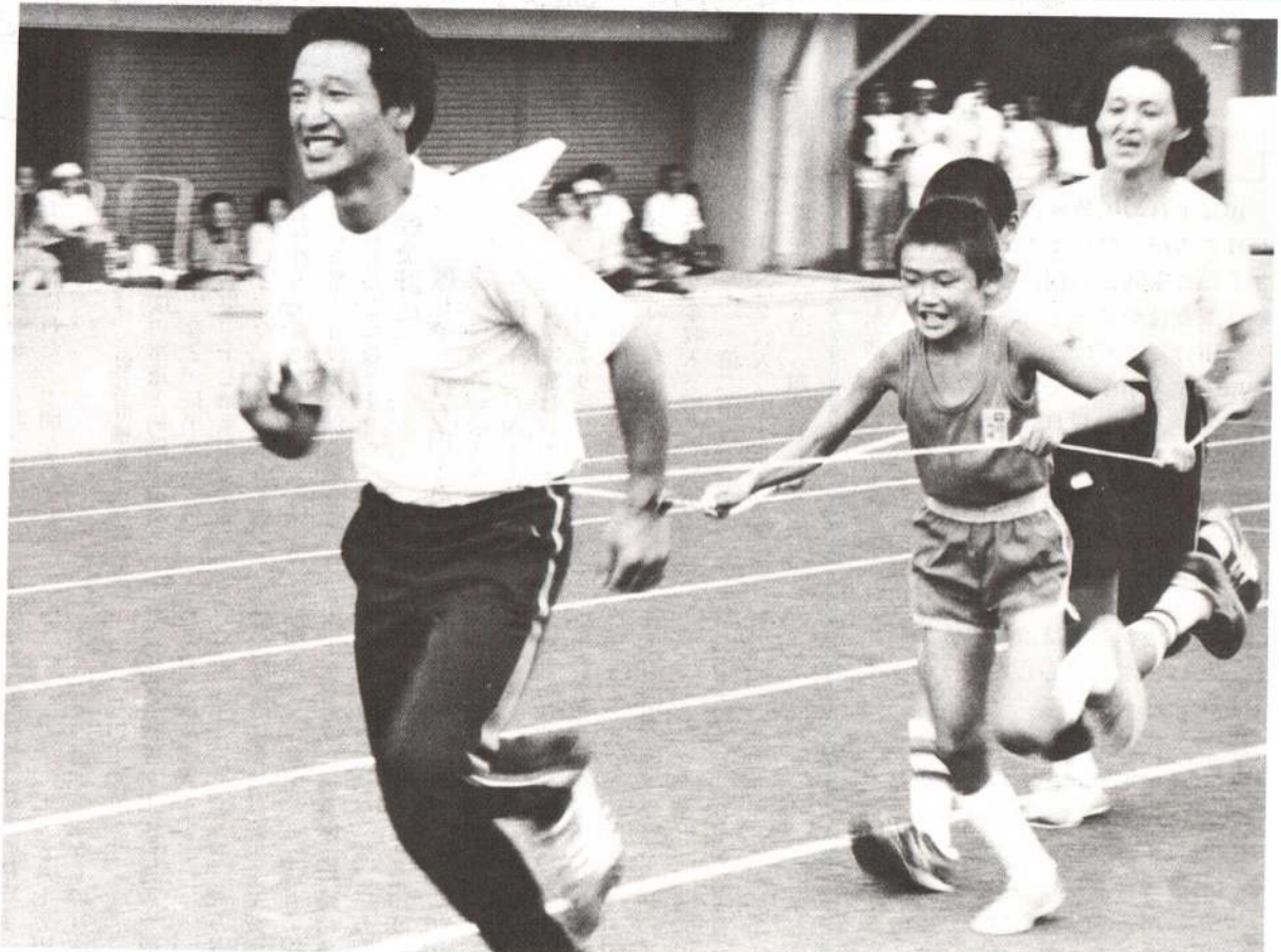
▲お父さんが運転手、お母さんが車掌、子供たちがお客さん——ゴール目指して超特急 (親子機関車レース)

9月8日、長根山陸上競技場でおよそ3,000人の市民が参加して市民運動会が開かれました。午前10時小学校女子400mリレーで競技が開始され、60歳以上リレーや綱引き、それに今年初めて加えられた職場対抗リレーや親子機関車レースなど24種目に熱戦を展開。チビッコからお年寄りまで、時折り降る雨をものともせず走ったり、力比べをしたりで健康増進と交流を深めました。