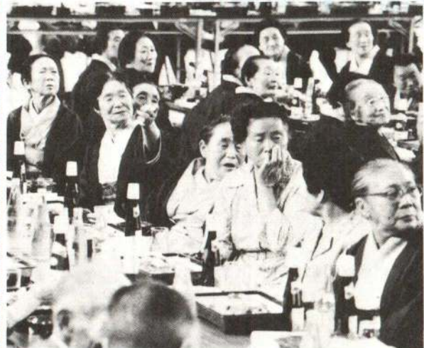
▲いつまでもお元気で——敬老会 8月31日の上川沿地区を皮切りに大館市敬老会が開催されています。9月7日には真中地区敬老会が開かれ、保育所の子供たちのお遊戯や婦人会の皆さんの踊りて敬老会を盛りあげました。