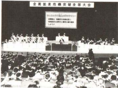
▲国の施策確立を強く要求していくことを決議しました。