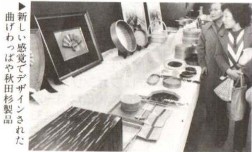
▲新しい感覚でデザインされた曲げわっぱや秋田杉製品

お菓子のデコレーション展(商工展)、実りの秋を祝う農産物展(農協まつり)、生鮮食品の特売(市場まつり)……「興そう 伸ばそう 郷土品」をテーマに今月2日から6日まで開かれた第6回産業祭は、市民体育館や城西体育館、卸売市場などを会場に、天候に恵まれたこともあって史上最高の人出でにぎわいました。