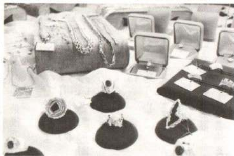
▲金銀のペンダントや指環などの即売も行われた黄金の古里展