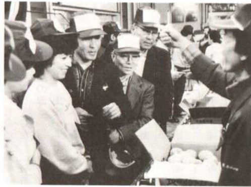
▲野菜や果物、魚類の特売、セリ売などが行われた市場まつり