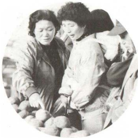
▲大館葉業百年祭とあって、会場はお菓子の香りで包まれました。農作物の出来を見る人たちにぎわいました。