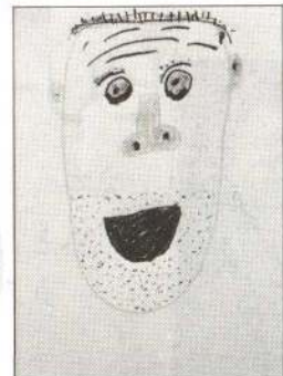
たはたはやとちゃん