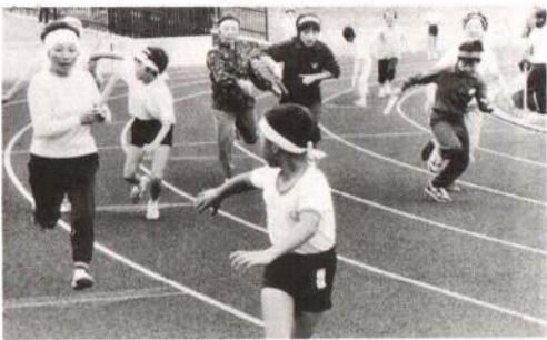
◀「おばあちゃん、まかせて」