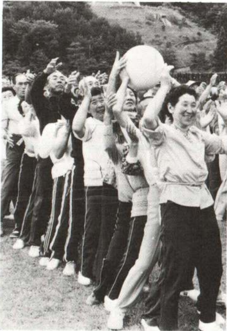
▲健康な体づくりは医療費の節減にもつながります。

国保加入者の皆さんには、「国保制度をささえる主役は自分たちである」ということを自覚していただき、医療費の節約と国保税の確実な納付、そして何よりもいちばん大切なことは、「健康な体づくり」を心がけてもらうということなの