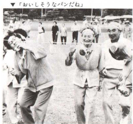
▼「おいしそうなパンだね」