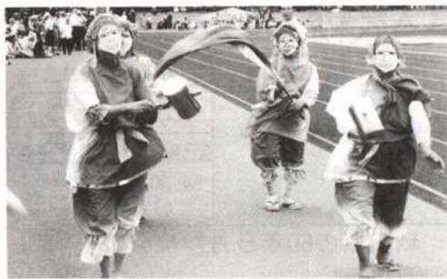
◀大黒様も応援です

恒例になった老人スポーツ大会が、7月13日長根山陸上競技場で開かれ、市内12支部から参加したおよそ3千人のお年寄りたちは、水運び競争やボールの旅、ドリブル競争、リレーなどに元気いっぱいプレーを展開しました。