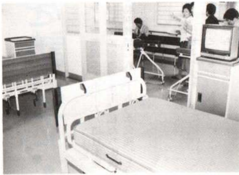
▲ 4人部屋が9室、2人部屋が3室、和室が2室