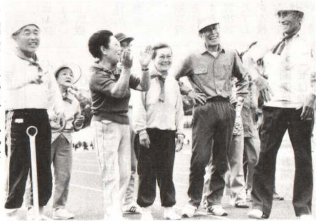
▶「勝ってよかった、よかった」

恒例になった老人スポーツ大会が、7月13日長根山陸上競技場で開かれ、市内12支部から参加したおよそ3千人のお年寄りたちは、水運び競争やボールの旅、ドリブル競争、リレーなどに元気いっぱいプレーを展開しました。