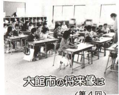
大館市の将来像は 〈第4回〉