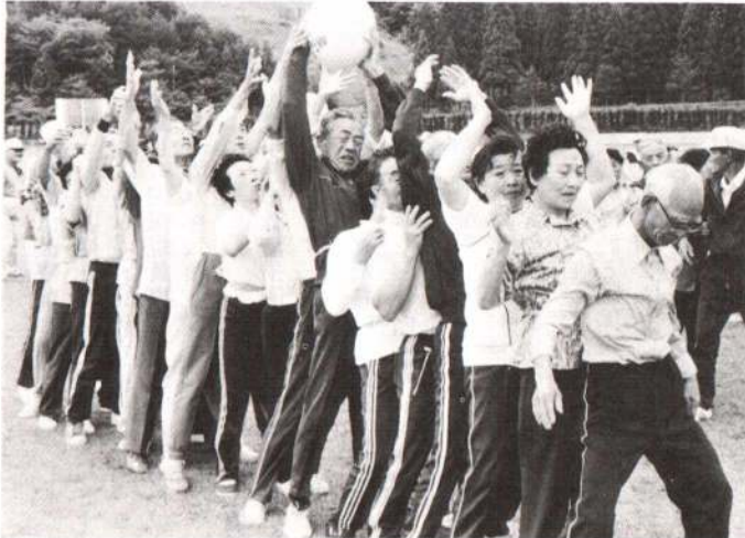
▲「早くボールを送って……」