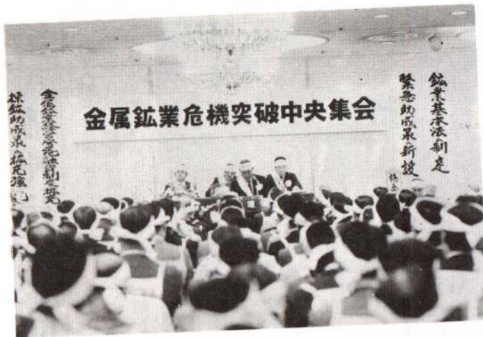
金属鉱業危機突破中央集会 探鉱助成策の拡充強化