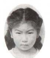
ただけ ゆきちゃん