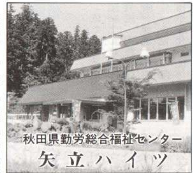
秋田県労務総合福祉センター 矢立ハイイツ

・多目的ホール(会議・宴会) ……100人 ・温泉の効用…リユーマチ、慢性湿疹、婦人病など ▽交通 乗用車…市役所前から約25分 バス…秋北バスターミナルから弘前行き急行バス約40分 ※送迎バスもあります。 ▽申し込み及び問い合わせ 大館矢立ハイイツ ☎51-2311