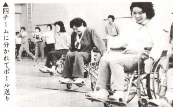
▲四チームに分かれてボール送り

10月12日、サンアビリティーズ大館で「スポーツ交流会」が開かれ、障害者とボランティア会員がスポーツを通じて親睦を深めました。この交流会は、今年3月ボランティア各団体が集まって連絡協議会を結成したのを記念して行われたものです。交流会は、ラムネ飲み競争やボール送り、車椅子競争など障害をもつ方の競技しやすい種目が生まれ、ボランティア会員と障害者がいっしょになってスポーツを楽しみました。