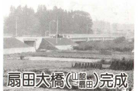
扇田大橋(山館扇田)完成

大館市山館と比内町扇田の米代川を渡る「扇田大橋」が、十月三十一日に完成しました。 この大橋は、県が五十三年度から調査を開始し、五十六年度から工事を行っていたもので、延長百六十五メートル、幅が九・七五メートルとなっています。 完成した大橋は、県道比内宮川線の橋で、米代川右岸の国道103線と左岸の国道285号線をつなぐもので、当市や鹿角市から鷹巣阿仁郡、秋田市方面を結ぶ最短ルートとして、今後大いに利用されるものと期待されます。