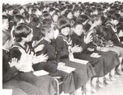
▲青少年健全育成弁論大会

かずに過ごしているでしょう。たとえ後始末が大変でも、能力が悪くても、子供がやさしい気持ちで手を貸してくれたときは、「助かったわ、ありがとう」、「とってもうれしかったわ」と大いに喜んでやるのが、他人のために奉仕する道へつながるしつけです。