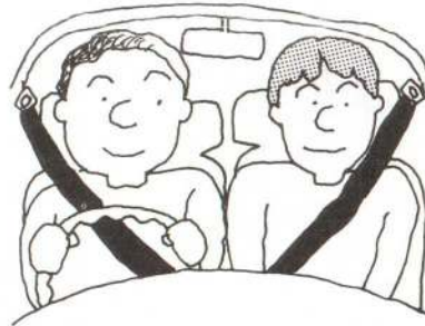
運転者も同乗者もシートベルトを

とき・11月10日(月) 午後6時30分開演 ところ・市民文化会館大ホール 入場料・S席 2,500円 A席 2,000円 B席 1,000円 入場券は各プレイガイドでお求め ください。