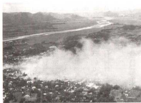
昭和31年大館大火(東上空から)

大館市史編さん委員会では『大館市史』第三巻(下)「昭和編」を刊行しました。 「昭和編」は、激動の昭和史六十年間の大館地方の歩みを、通史的に編さんしたものです(本文一) 第五章 一五年戦争と町・村 第六章 終戦と町・村 第七章 大館市の誕生と発展 〈価格〉 一冊 五千円 〈申し込み〉 大館市役所内 大館市史刊行会 ☎4933111 内線273 ※なお、これまで刊行した第一巻「原始・古代・中世編」、第二巻「近世編」、第三巻(上)「近・現代編」、第四巻「民俗・文化編」の残部もありますので、合わせてご購入ください。(総額二万三百円)