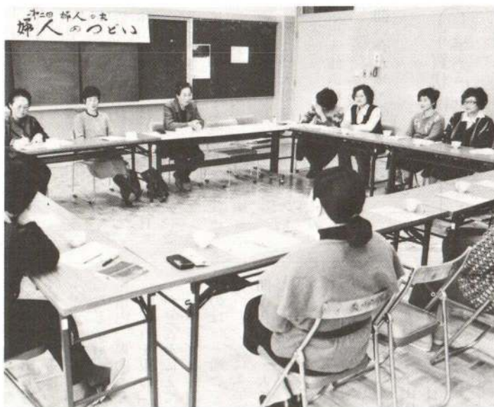
「婦人のつどい」では、老後の生活について切実な問題が次々に出されました。