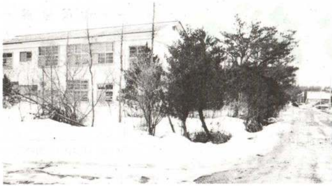
秋北ジーンズが建てられる旧林業試験場跡地(獅子ヶ森)

秋北ジーンズは、獅子ヶ森の県林業試験場跡地の一部、六千七百八十平方メートルを市から買い取り、建物千六百六十平方メートルを建設し、七月からの操業を予定しています。資本金は二千万円で、投下固定資本は二億八百万円。第二期工事とし