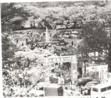
今年の大館さくらまつりは4月29日から