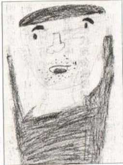
はが まみこちゃん おうまさんごっこをして くれるおとうさん、 大好き。