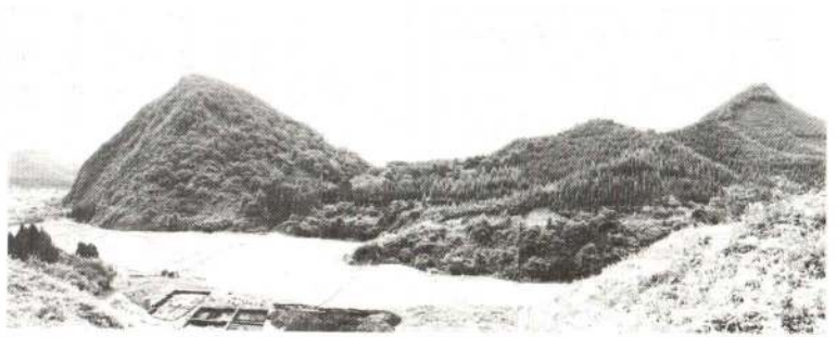
▲「矢立廃寺」跡からみた男神山(右)と女神山(左)、両山間の鞍部が細越