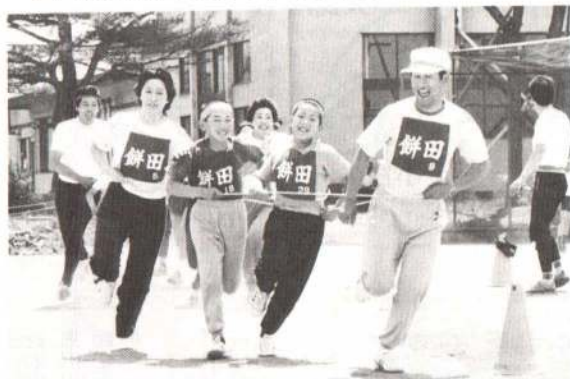
▲お父さんが汽関車です (下川沿地区)

六月七日二井田、真中、下川沿、釈迦内の各地区では、真夏を思わせるような天気の中で、さなぶり運動会が開かれました。運動会には幼児からお年寄りまで参加し、リレーや綱引き、どじょうつかみ、俵かつぎなどの種目に熱戦を繰り広げ親睦を深めました。