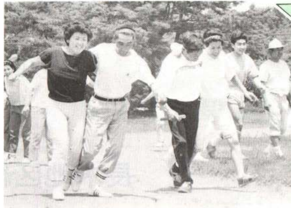
▲二人の息がピッタリ? (真中地区)