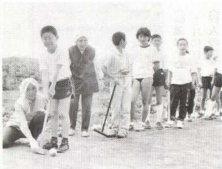
▲お年寄たちは手とり足とりして指導します

同小学校では、昨年の春、正課クラブの希望を取りまとめたところ、「ゲートボール」を希望する児童がたいへん多くいました。しかし、指導者がいなくて困っていたところ、話を聞いた地域の老人クラブが協力を申し出て四月から実施することができました。