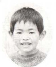
なみおかとおるくん 〈おとうさん早くケガが おなおりますよう〉