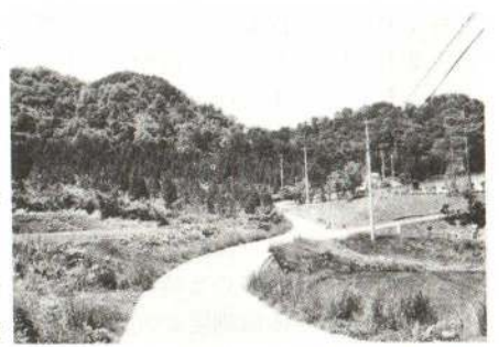
▲中央の鞍部が只越、右が道目木更生園

十六世紀、浅利氏の時代のこととして、「十二所郷土読本」巻一(第三十課、軽井沢古城跡)に、浅利氏と軽井沢城主額田淡路守との戦いで、浅利方は松明をもって只越をのぼりくだりし、それを見た額田方は大軍の来襲と見て、城下を流れる米代川の深淵に身を投げて生害した、とある。その真偽はさておいて、口碑にあらわれた只越は、時代背景の中で見逃せないものがある。