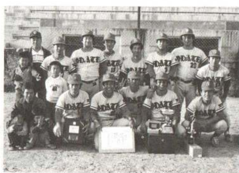
▶大館市地区対抗野球大会で優勝したときの記念写真

会は、会員の年齢に幅があるため、たまに会員間での話し合いにギャップができます。若い人たちが先輩の体験談を聞くことにより、人生にプラスとなっていることもあります。また、大きな町内のわりには会員が少ないため、もっと多くしていかなければなりません」と話していました。