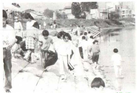
1,500人が参加してクリーンアップ作戦

5月31日、恒例になったクリーンアップ作戦が長木川や長根山運動公園などで展開されました。参加者は「年々ごみは少なくなってきたおり、市民のマナーも向上しているようですね」と話していました。