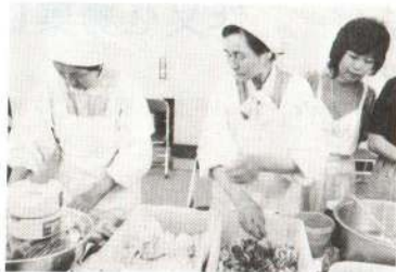
六月二十一日、大館青年会議所主催の全国地域おこし物産展の中で行われた「漬物伝承教室」