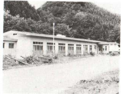
▲改修をする老人福祉センター

市に移譲するため、内装と外壁の改修及び給湯管の布設工事を行い、高齢者や身体障害者の活動拠点とします。