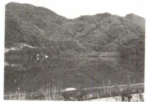
手前が滝の沢沈殿池 中央の鞍部が山田越え