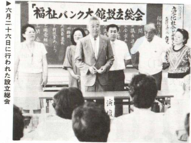
六月二十六日に行われた設立総会