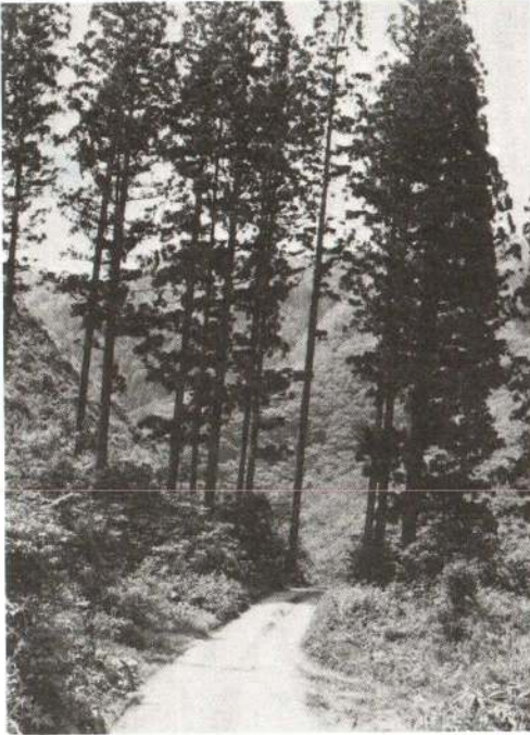
▲杉木立に囲まれ、昔の面影を残している 「花岡越え」

この道沿いには、花岡城主浅利 定頼が居城したといわれる「七ツ 館」、「桂清水」の城跡や、ぼだい寺 である信正寺(秋田六郡三十三番 観音礼所)がある。 現在ではこの峠道も拡幅整備が