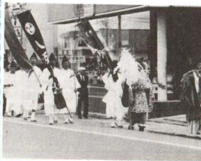
▲八坂神社祭典の際の「みこし巡行」

片山にある「八坂神社」はその名の示すとおり、京都市東山区祇園町の八坂神社を分祀したものとされていて、主神に素盞鳴尊、副神に木花咲耶姫命を祀っています。むかし大館地方では、村々のお祭