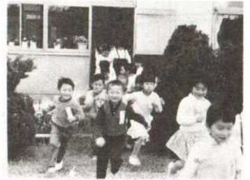
▲城西小学校の子どもたち