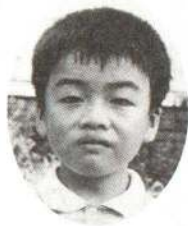
ほそぼみ たかしちゃん おとうさんは、かっこいいから好き。