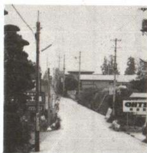
▲神明社へ向う御坂の道

羽州街道の名は、出羽国(現在の秋田・山形両県)を縦断するところ由来している。奥州街道を福島で分かれ、山形を経て院内峠から秋田藩領に入り、久保田に至る。久保田から北へは、松山(能代)、綴子、大館を通過して矢立峠まで至る秋田藩領内最長の街道である。