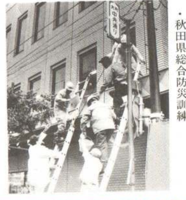
・秋田県総合防災訓練

・成人式 ・平和祈念戦没者慰霊式 ・第十四回東北総合体育大会ウエートリフティング競技開催 ・第十二回「教育の日」 ・交通安全市民大会