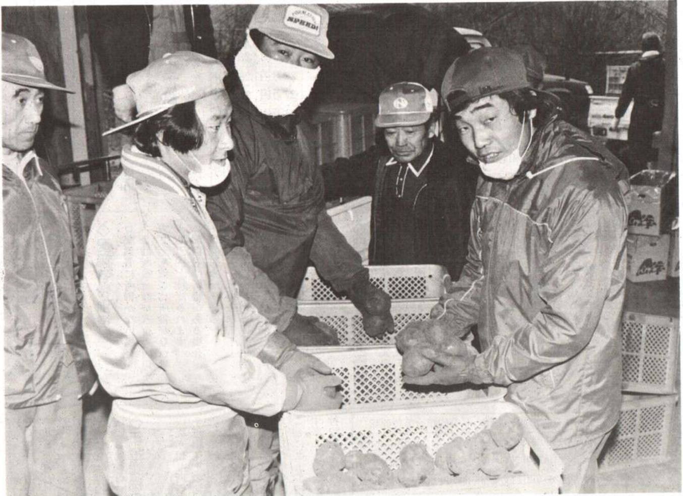
▲山の芋の出荷 (真中地内)