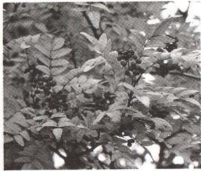
サンシヨウ 利用部分(果実)

高さ三メートル程になる落葉低木の多年草で、全国各地に自生している。葉は、奇数の羽状複葉で長楕円形である。春先に淡黄色の小花をつけ、果実は球形で、熟すにしたがつて果皮は緑色から緑黄色、紅色へと変色するが、内部の種子は六月ころまで白色を呈し、以後は黒