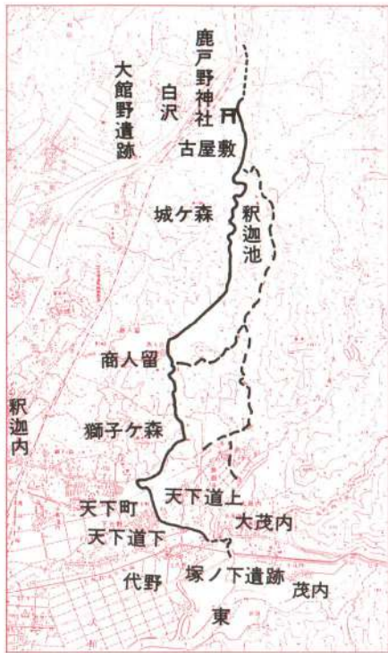
▶今後は実線を天下道と想定したが、ほかに破線の道も存在する。

商人留から北へは城ヶ森の東麓に沿つて白沢字古屋敷へ抜ける。この道筋には釈迦池々底に縄文時代遺跡も確認され、より古い時代相を示す。また古屋敷の一隅には鹿戸野神社が座すが、これは『郷村史略』白沢村の項に「社地 観音 文治五年亀井六郎重清 義経公の供に後れ 髪中に籠めし処の佛鉢を此処に置けり 里人堂を建て産神とす」とある堂と考えられ