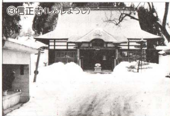
③ 信正寺(しんしょうじ)