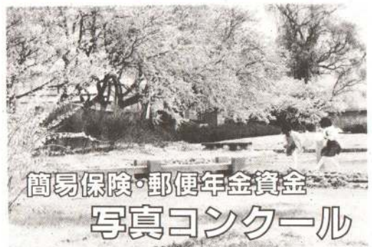
簡易保険・郵便年金資金 写真コンクール

郵便局では、皆さんの簡易保険・郵便年金資金でつくられた公共施設や加入者福祉施設を題材とした写真を募集しています。奮って応募ください。 規格 一般の部……四ツ切(カラー! 白黒)またはカラスライド(35ミリ以上) 小・中学生の部……キャビネ(カラー・白黒)判以下の大きさ 応募点数 一般の部……5点以内 小・中学生の部……3点以内 ※作品は単写真または組写真(1組3枚以内)とします。 締め切り・7月31日 応募先・お近くの郵便局へ(簡易郵便局を除きます) 問い合わせ・大館郵便局保険課 ☎ 4210480