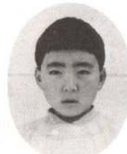
わだじゆんいちちゃん おとうさんの全部が好き。