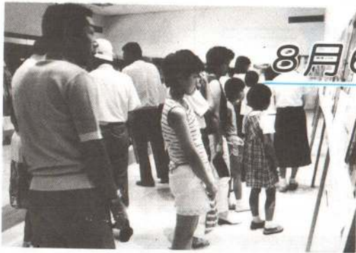
▶ 昨年の「市民のつどい」