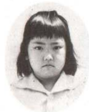
あぶかわさきこちゃん トランプして遊んでく れるよ。