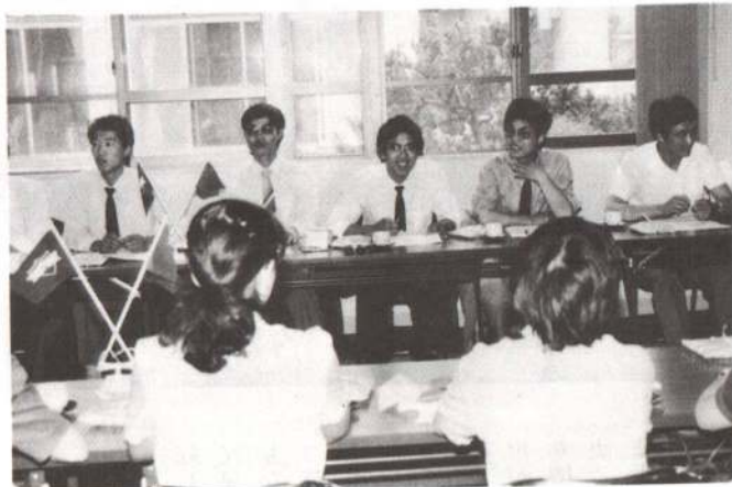
▲県立営農大学校中国農業技術研修生と当市の青年との交流会が開かれ、活発な意見交換が行われました。