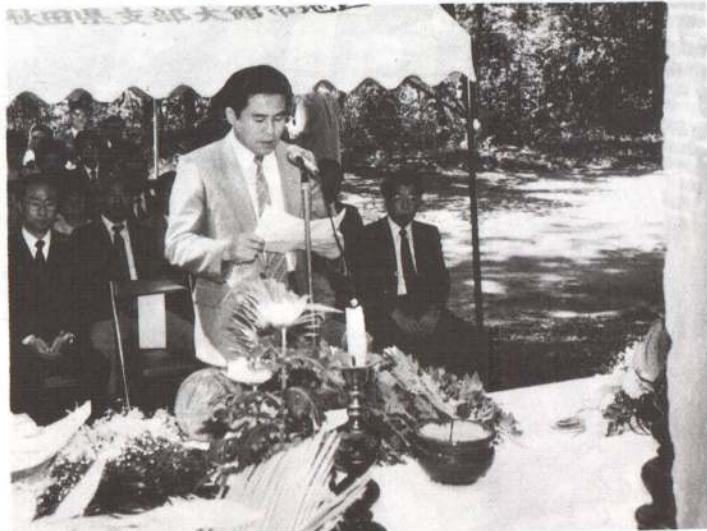
▶中国殉難烈士慰霊の碑の前で、慰霊の言葉を述べる高書記官（中国大使館）。

六月三十日から七月五日まで「日中友好平和交流事業」が、中央公民館とサン・アピリテーズ大館を会場に開かれました。 日中友好条約締結十周年に当たる今年度は、例年行われている中国文化工芸作品展や中国農業技術研修生との交流会などのほかに、太極拳講習会や中国針灸相談室なども開催され、会場を訪れた市民は、中国文化に肌で触れながら理解を深めていました。 また、六月三十日に十瀬野公園墓地では、中国大使館員や市関係者など約六十人が参列し、悲惨な戦争の犠牲となられた中国人殉難者の慰霊祭が行われ、殉難者の冥福を祈るとともに恒久平和と日中友好を誓い合いました。