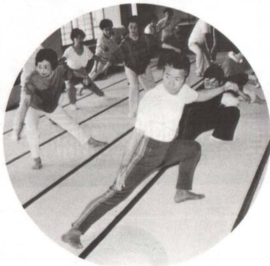
◀中国数千年の歴史の中で、武術として培われてきた健康法「太極拳」

六月三十日から七月五日まで「日中友好平和交流事業」が、中央公民館とサン・アピリテーズ大館を会場に開かれました。 日中友好条約締結十周年に当たる今年度は、例年行われている中国文化工芸作品展や中国農業技術研修生との交流会などのほかに、太極拳講習会や中国針灸相談室なども開催され、会場を訪れた市民は、中国文化に肌で触れながら理解を深めていました。 また、六月三十日に十瀬野公園墓地では、中国大使館員や市関係者など約六十人が参列し、悲惨な戦争の犠牲となられた中国人殉難者の慰霊祭が行われ、殉難者の冥福を祈るとともに恒久平和と日中友好を誓い合いました。