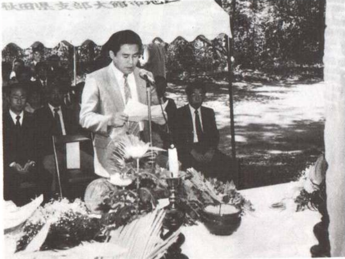
▶中国殉難烈士慰霊の碑の前で、慰霊の言葉を述べる高書記官（中国大使館）。

六月三十日から七月五日まで「日中友好平和交流事業」が、中央公民館とサン・アピリテーズ大館を会場に開かれました。 日中友好条約締結十周年に当たる今年度は、例年行われている中国文化工芸作品展や中国農業技術研修生との交流会などのほかに、太極拳講習会や中国針灸相談室なども開催され、会場を訪れた市民は、中国文化に肌で触れながら理解を深めていました。 また、六月三十日に十瀬野公園墓地では、中国大使館員や市関係者など約六十人が参列し、悲惨な戦争の犠牲となられた中国人殉難者の慰霊祭が行われ、殉難者の冥福を祈るとともに恒久平和と日中友好を誓い合いました。