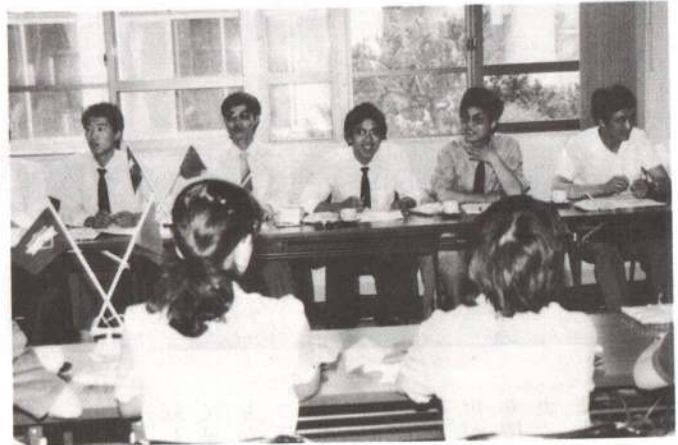
▲県立営農大学校中国農業技術研修生と当市の青年との交流会が開かれ、活発な意見交換が行われました。